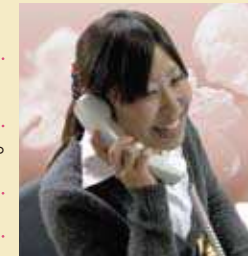
ニックネーム【まきちゃん】